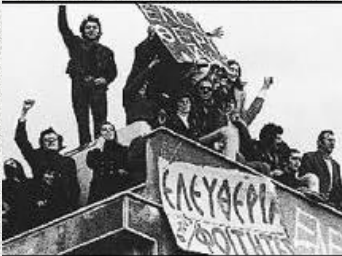
Η ΚΑΤΑΛΗΨΗ ΤΗΣ ΝΟΜΙΚΗΣ