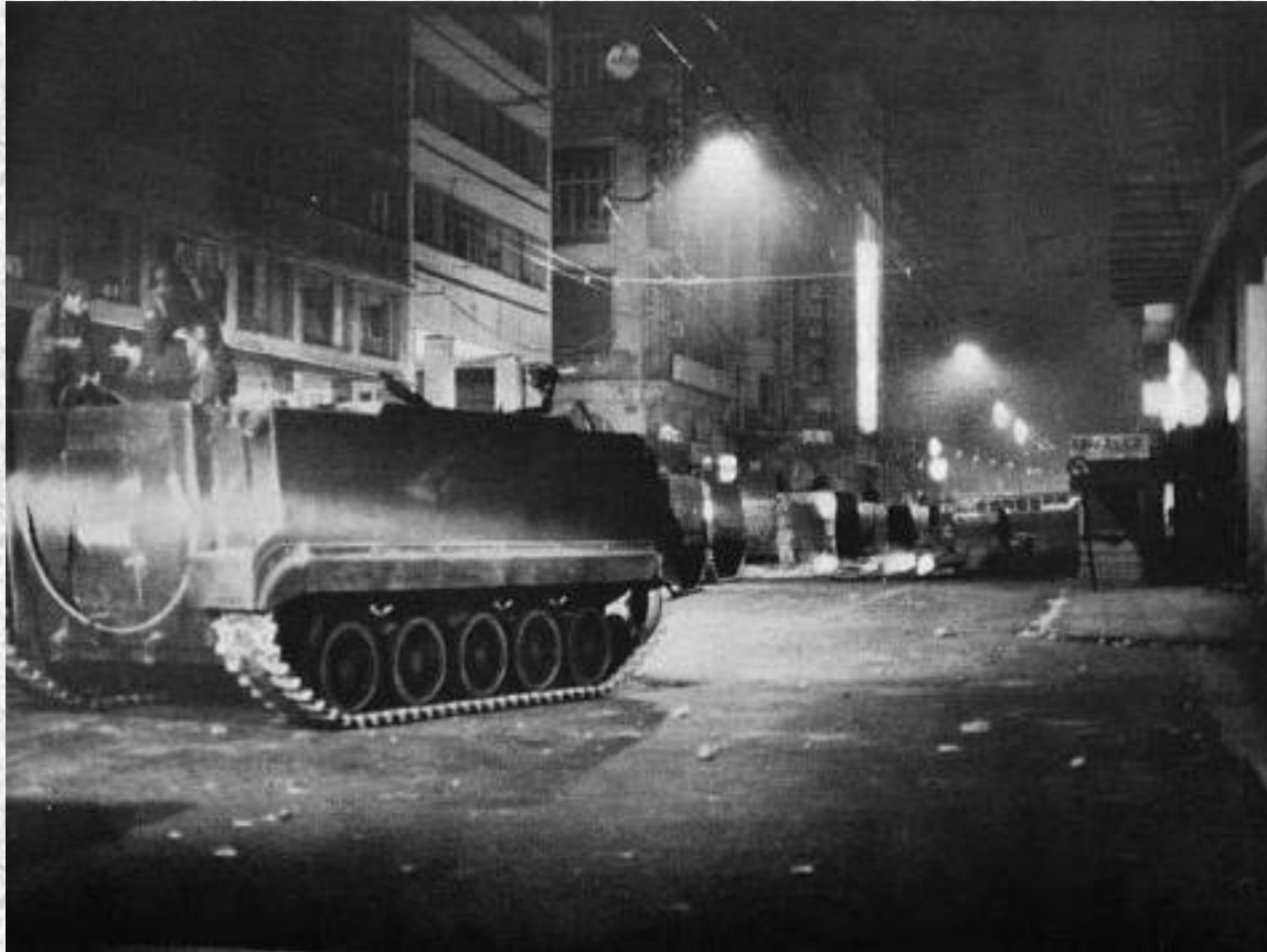
ΠΑΡΑΣΚΕΥΗ 16 ΝΟΕΜΒΡΙΟΥ 1973 ΤΕΘΩΡΑΚΙΣΜΕΝΑ ΠΕΡΙΠΟΛΟΥΝ ΣΤΟΥΣ ΔΡΟΜΟΥΣ