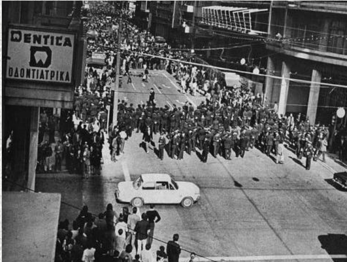
ΠΑΡΑΣΚΕΥΗ 16 ΝΟΕΜΒΡΙΟΥ 1973 ΑΣΤΥΝΟΜΙΑ ΣΤΗΝ ΠΑΤΗΣΙΩΝ , ΚΟΝΤΑ ΣΤΗ ΔΙΑΣΤΑΥΡΩΣΗ ΤΗΣ ΒΕΡΑΝΖΕΡΟΥ