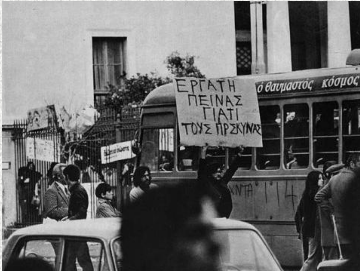
ΦΟΙΤΗΤΕΣ ΜΕ ΠΛΑΚΑΤ ΣΤΟΥΣ ΔΡΟΜΟΥΣ ΓΥΡΩ ΑΠΟ ΤΟ ΠΟΛΥΤΕΧΝΕΙΟ