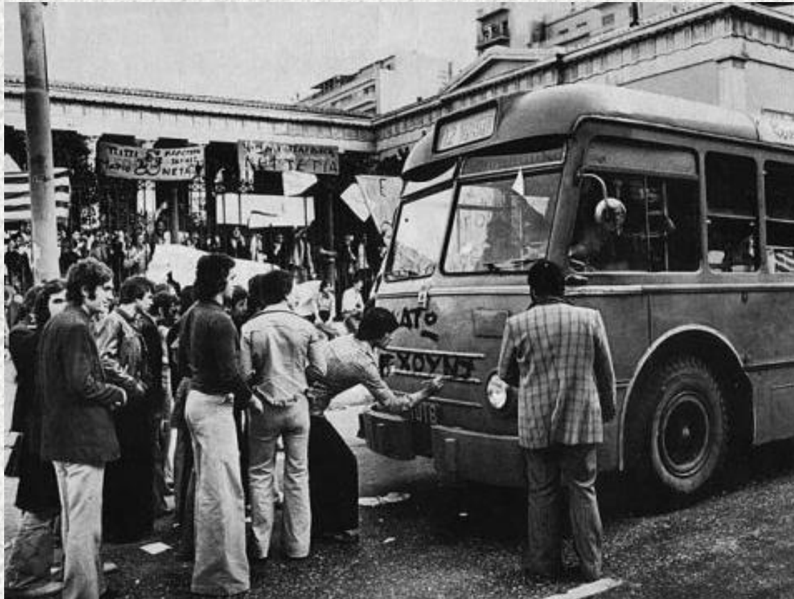
ΦΟΙΤΗΤΕΣ ΓΡΑΦΟΥΝ ΣΥΝΘΗΜΑΤΑ ΚΑΤΑ ΤΗΣ ΧΟΥΝΤΑΣ