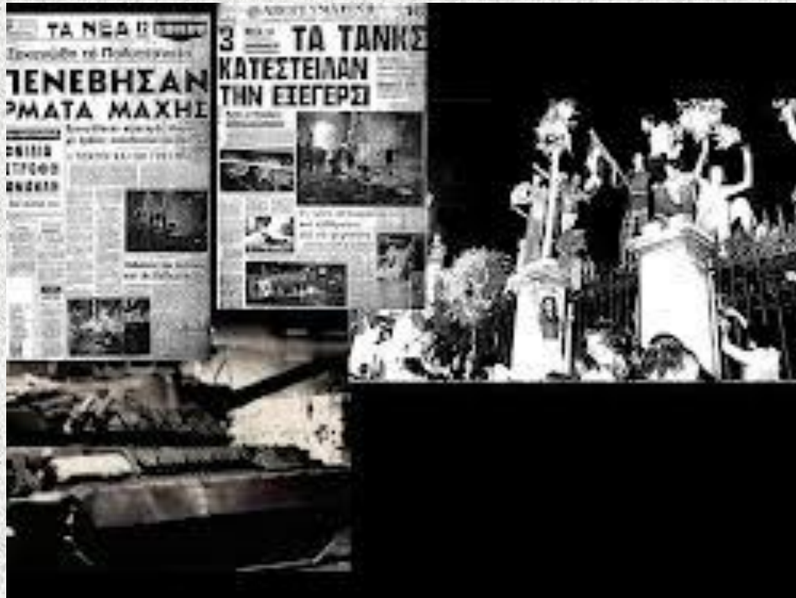
ΤΑ ΠΡΩΤΟΣΕΛΙΔΑ ΤΩΝ ΕΦΗΜΕΡΙΔΩΝ ΤΗΣ ΕΠΟΜΕΝΗΣ ΜΕΡΑΣ