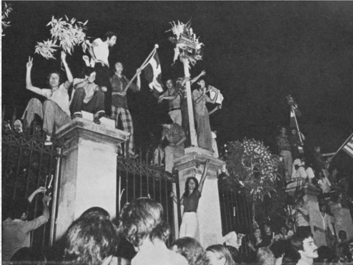
ΣΑΒΒΑΤΟ 17 ΝΟΕΜΒΡΙΟΥ 1973 ΦΟΙΤΗΤΕΣ ΣΤΑ ΚΑΓΚΕΛΑ ΤΟΥ ΠΟΛΥΤΕΧΝΕΙΟΥ