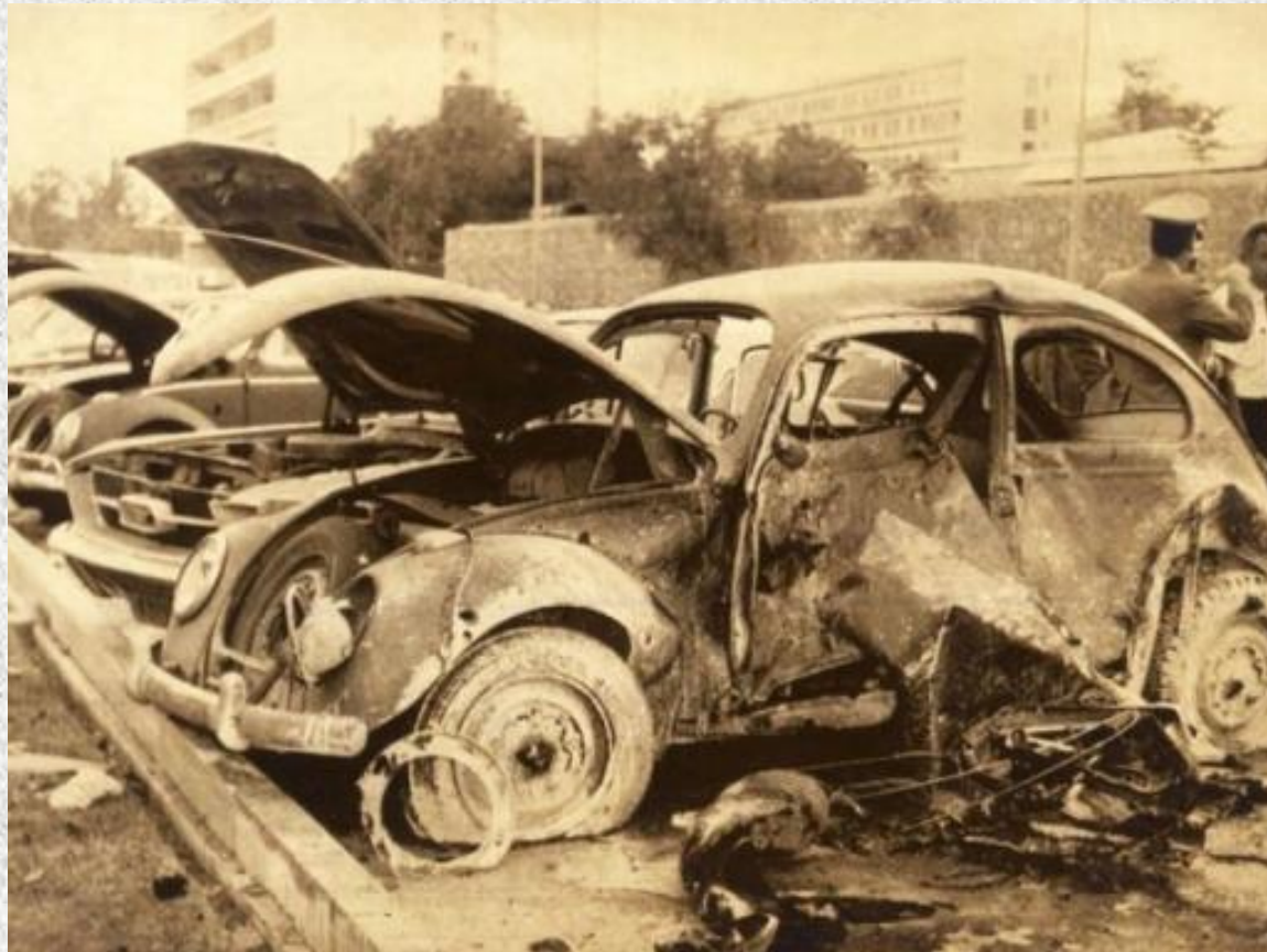
ΑΝΑΤΙΝΑΞΗ ΑΥΤΟΚΙΝΗΤΟΥ ΣΤΗΝ ΑΜΕΡΙΚΑΝΙΚΗ ΠΡΕΣΒΕΙΑ