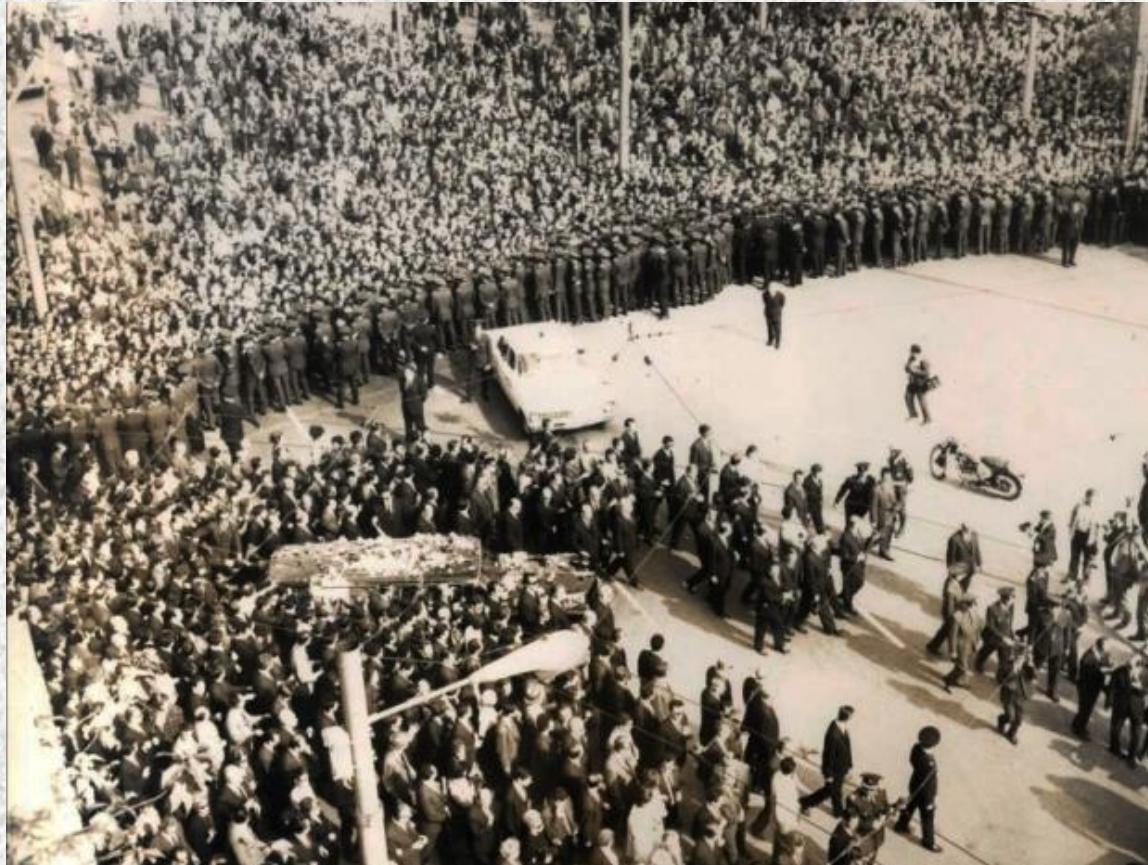
Η ΚΗΔΕΙΑ ΤΟΥ Γ. ΠΑΠΑΝΔΡΕΟΥ