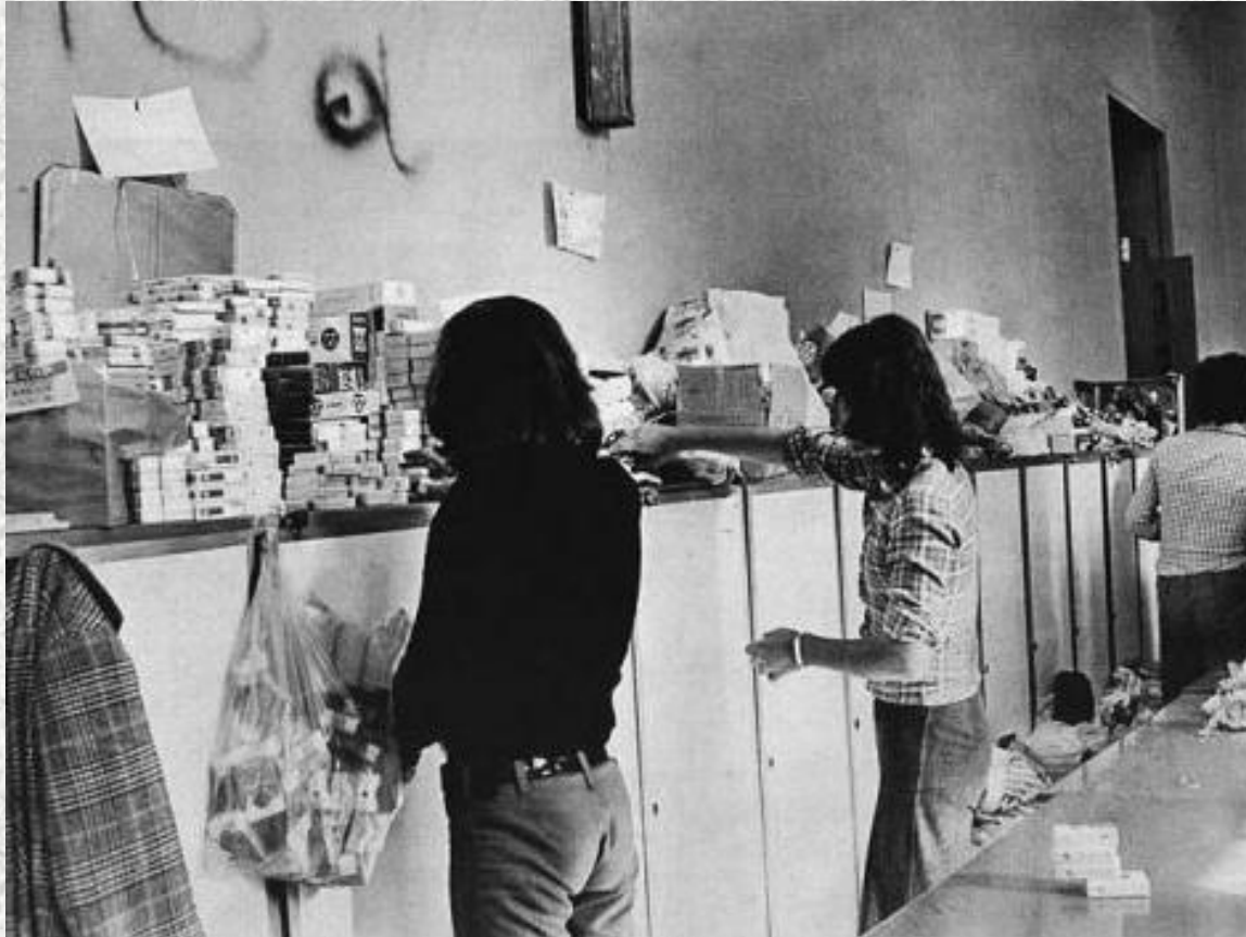
ΠΡΟΜΗΘΕΙΕΣ - ΠΡΟΣΦΟΡΑ ΤΟΥ ΛΑΟΥ ΤΗΣ ΑΘΗΝΑΣ ΣΤΟΥΣ ΦΟΙΤΗΤΕΣ